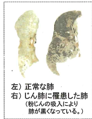
左) 正常な肺 右) じん肺に罹患した肺 (粉じんの吸入により肺が黒くなっている。)

現在、じん肺を治す根本的な治療がないため、じん肺にかからないための措置として、粉じんの発生源対策、局所排気装置等の適正な稼働、呼吸用保護具の適正な着用などにより、粉じんへの「ばく露防止対策」を徹底することが重要です。